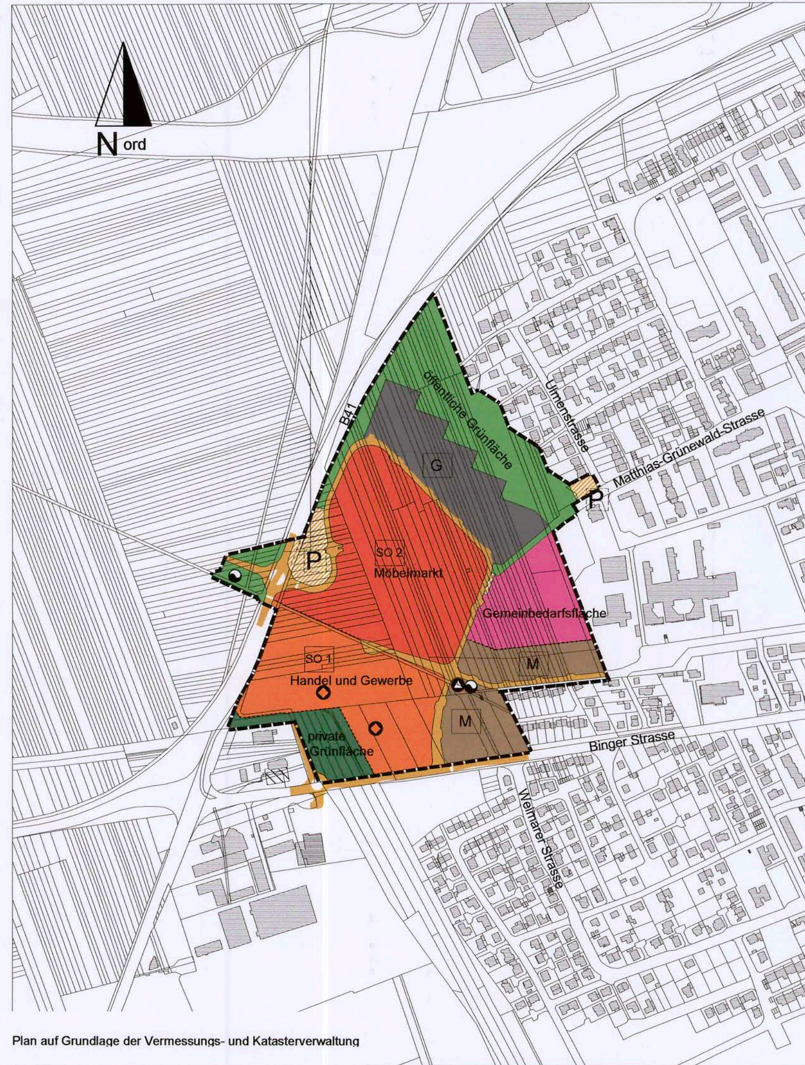
Plan auf Grundlage der Vermessungs- und Katasterverwaltung